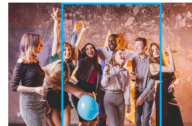
Beispiel Bild Querformat