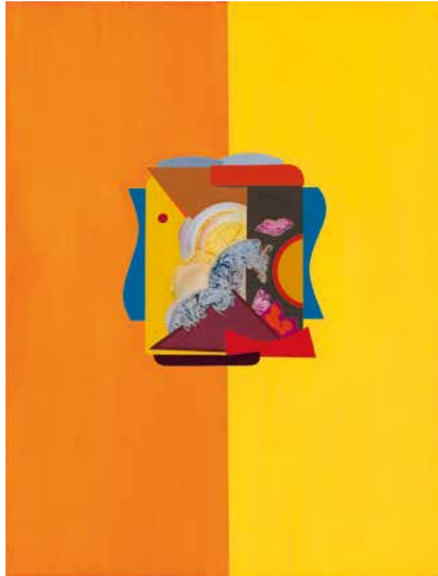
Posivist Haus positiv veranlagt 1968 Öl auf Leinwand 116 x 89,2 cm