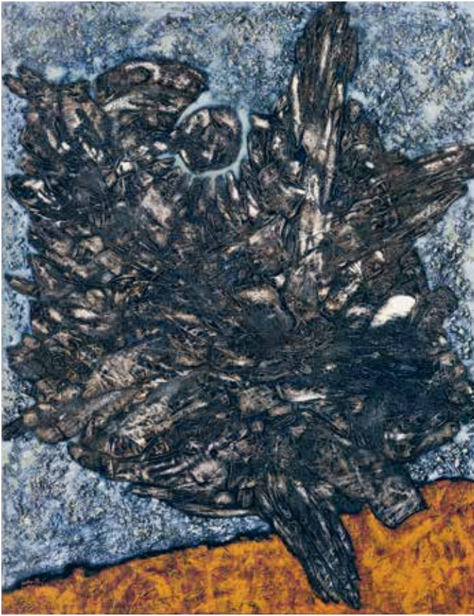
Fabelwesen 1958 Öl auf Leinwand 130 x 100 cm