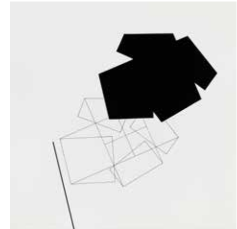
KKFF mit Schatten 8.7.1996 Scherenschnitt, Tusche 60 x 69 cm