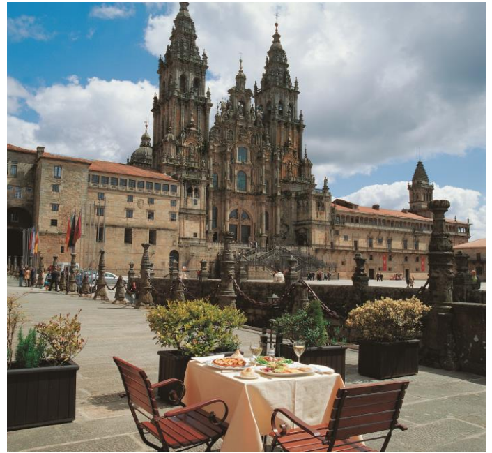
Santiago de Compostela: Plaza Obradoiro und Kathedrale

mit kurzen Abschnitten auf dem Jakobsweg (Weltkulturerbe)