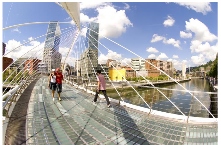
Bilbao: Zubizuri-Brücke