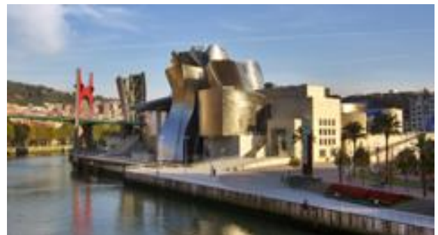
Bilbao, Guggenheim-Museum

8. Tag Mittwoch, 15. September 2021 Weiterfahrt durch die äusserst reizvolle Küstenlandschaft zu den Höhlen von Altamira mit den schönsten Malereien der Steinzeit (Nachbildungen) und nach Santillana del Mar (nach Jean-Paul Sartre schönstes spanisches Dorf). Spaziergang im Dorf und Mittagspause. Anschliessend Weiterfahrt nach Bilbao . Stadtbesichtigung mit der Zubizuri-Brücke von Calatrava, die wie ein aufgeblähtes Segel wirkt, der Altstadt mit engen Gassen, historischen Gebäuden und Kathedrale sowie dem historischen Museum und den zahlreichen Bars und Kneipen um die Plaza Nueva. Abschiedsessen in einem lokalen Restaurant. Übernachtung im Hotel Hesperia in Bilbao .