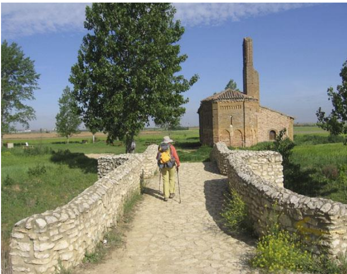
Auf dem Jakobsweg